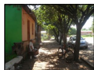
RUA GEN. SALVADOR PINHEIRO MACHADO