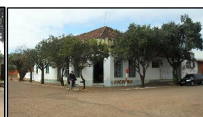
02—CASARÃO HERACLIDES CALDAS