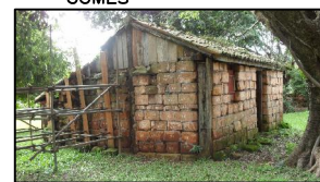
03—CASA DE PEDRAS