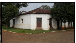
04—RESIDÊNCIA RODOLFO MIRANDA