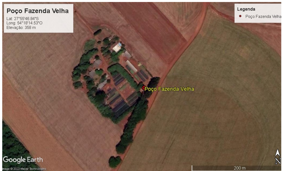
Figura 2. Detalhe da localização da área onde deverá ser perfurado o poço em Giruá.

O Município de Giruá irá indicar à Contratada uma pessoa da comunidade ou funcionário da Prefeitura, que conheça a área de trabalho e o ponto locado, para acompanhamento parcial dos trabalhos.